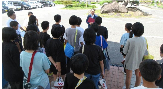
子どもたちを迎える今井議長

6年1組・2組の子どもたちは5班に分かれて庁舎内の見学、その後議場に入り出席番号順に着席。議場では番号順に名札があり着席。議長より名前を呼ばれた後で、各班ごとに質問席に立ちました。