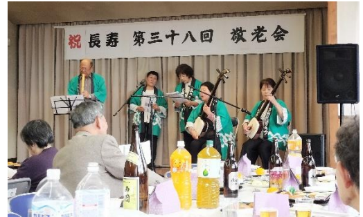
敬老会 11 17

朝9時から集まってのおはぎづくり。グループに分かれあんこ、黄な粉、胡麻の3種のおはぎ餅と野菜たっぷりのスープ、多彩なお漬物などの手作り尽くしでおもてなし。合間に社協の職員から「よく出かけ、よくおしゃべりし、よく笑う人は長生き」とのお話。さっそくグーチョキパーの手遊びで笑顔が弾けました。