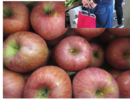
待ちかねた富士リンゴ

ゾーンもリニューアル。魅力が広がりました。大型バスで狭い駐車場はいつもいっぱい。もう少し駐車場を広くしないとお客様のニーズに応えられません。道の駅のトイレには、いつもお花が活けられ、清潔感とおもてなしの心を感じさせます。