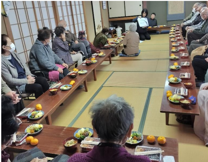
11.20 ふれあいネットワークのおはぎ会 西塩沢公民館

朝9時から集まってのおはぎづくり。グループに分かれあんこ、黄な粉、胡麻の3種のおはぎ餅と野菜たっぷりのスープ、多彩なお漬物などの手作り尽くしでおもてなし。合間に社協の職員から「よく出かけ、よくおしゃべりし、よく笑う人は長生き」とのお話。さっそくグーチョキパーの手遊びで笑顔が弾けました。