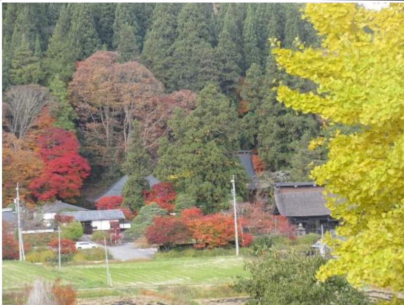
権現山から望む津壺。美しい里山秋です。

「久しぶりだね」「元気だったかい」と再会を喜び声にあふれ、地域のみなさんの芸能発表に笑顔が広がります。トップバッターに私もリコーダーで参加。365歩のマーチ、その替え歌などで楽しんでもらいました。民謡、太鼓演奏、ファミリーによる「リンゴの歌」、最後は参加者によるカラオケ。西塩沢は芸人や歌の上手な方が多いなと感心しました。笑顔があふれた敬老会でした。