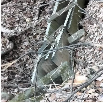
大雨で設備が壊れた。

藤沢の下水処理場に向かう道の右側の水路が大雨で破壊され復旧工事が予算化されました。この排水路は桐原地区の水田からの排水で、コンクリートのU字溝が60m修復されます。上流部で使われている円筒管に付け替えられます。