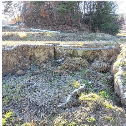
田の畔から河川に向けての法面 が崩落。復旧工事は11m