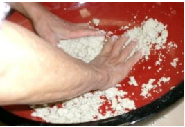
JA女性会による 「ソバ打ち講習」 ソバ味会のご 指導で初挑戦

良い映画を見る会の上映会は今回で4回目。JA女性会が最初からスタッフとして正式参加し、上映映画を決めるところからかかわっていただきました。立科の女性部の底力を見せてもらいました。運営的にも大成功で、「80代に入り、タイムリー」「家族を大切にしようと思いました」「夫と見られてとても良かった」など多くの感想が寄せられました。映画館がなくなったため、遠く佐久穂町からの参加者も。ご協力いただきました皆さん、本当にありがとうございました。