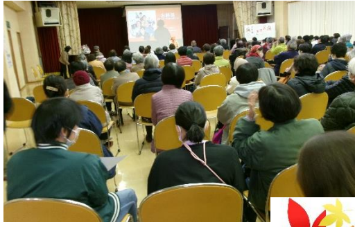
会場いっぱいの参加者 ご協力ありがとうございました。

11月26日（日）老人福祉センターを会場に3回上映された第4回の映画会。午前10時開会の回では100席用意した椅子が足りずに次々と追加する大賑わいでした。