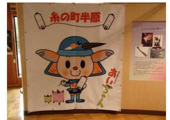
愛川町のユルキャラ アイちゃん

立科町と姉妹都市になっている神奈川県愛川町に議会の親善交流があり参加しました。りっぱな郷土資料館があって、愛川町の歴史、風土が紹介されていました。多くの中学生が見学に来ていました。