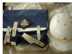
小学校のカバンとヘルメット