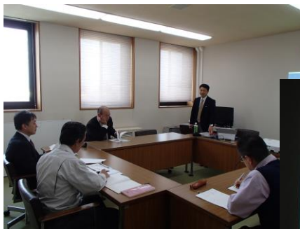
スライドを使っでの説明と質疑

搾乳牛60頭を飼う農家にお聞きしました。夫婦二人で、朝五時起きで搾乳機で一日二回の搾乳をします。できるだけ草を食べさせています。現在の価格が、維持されることが、重要。TPPは、決議守っていない！とキッパリ