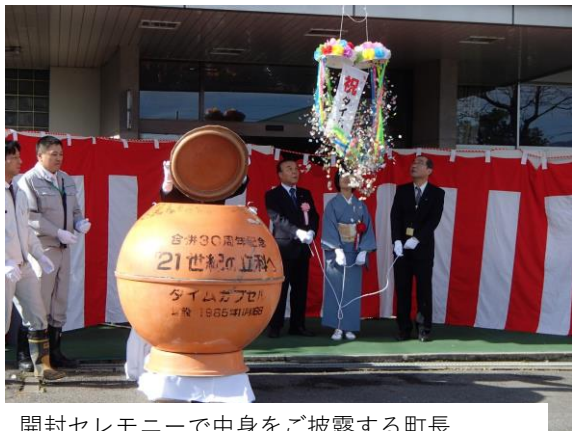
開封セレモニーで中身をご披露する町長

立科町合併60周年記念式典の前に、1985年11月16日に埋めたタイムカプセルを30年ぶりに掘り出し、また新たなカプセルを埋めました。タイムカプセルのふたには、当時の役場担当者の名前とともに、冒頭の言葉が書かれていました。立科町はこれからもこの言葉のような町であり続けてほしいと思います。