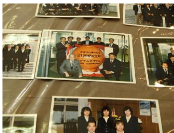
埋めた当時の町長など関係者のみなさんの写真