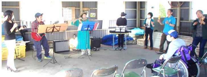
公民館敷地内の卓球場でコンサート、参加者も一緒に演奏。