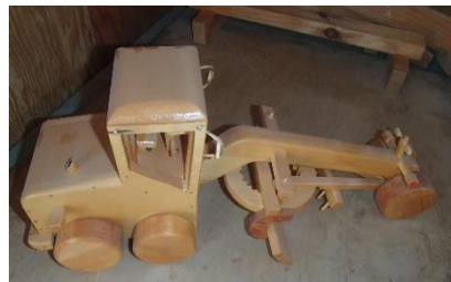
夢工房の木工作品 働く車「シリーズ