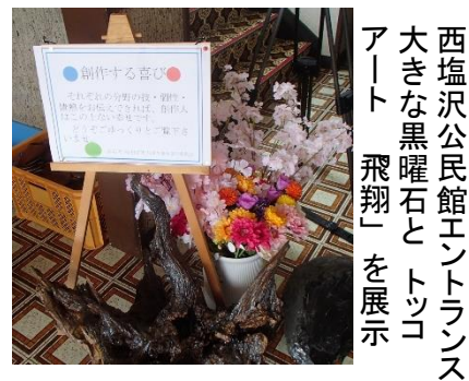
西塩沢公民館エントランス 大きな黒曜石と「トッコ アート 飛翔」を展示

これまでは西塩沢の住民の方が中心でしたが、思い切って近隣にまで広げ、多くの技を見ていただきました。