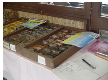
五無齋さんが集めた明治の石・ 鉢物セットがお目見え