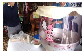
自分で創る綿 菓子、子ども たちに大人気。