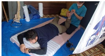
体のゆがみ拝見します