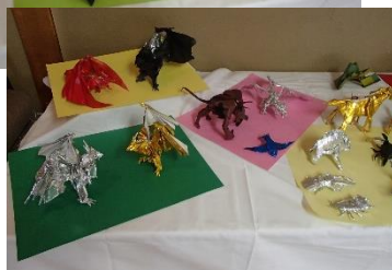
折り紙名人のドラゴン・カブトムシな ど。1枚の紙からどうやって作るの か。皆驚いていました。