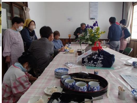
公民館では地域のお母さんがおもて なし。地元野菜を使ったお漬物、煮 物・スイーツなどが提供され、交流の 輪が広がりました。