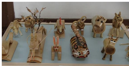
竹で作った十二支