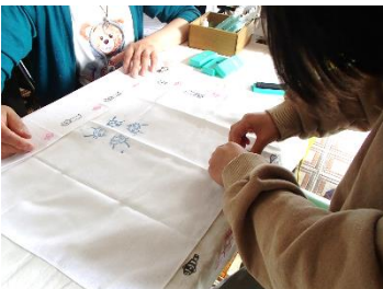
My ハンカチde ハンコ