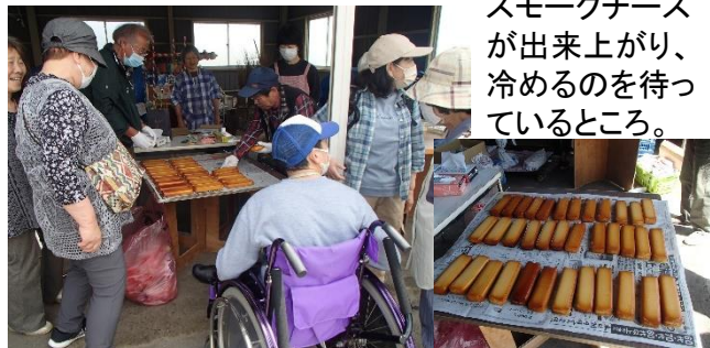
スモークチーズ が出来上がり、 冷めるのを待つ ているところ。