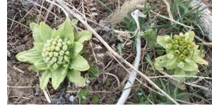
我が家の畑のフキノトウ