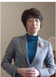
ながせ由希子 【参議院選挙区】