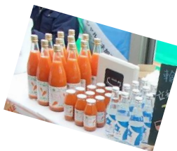
立科屋の人参ジュース うちの孫が大好きです。