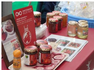
町内産の農産物にこだわって作ったナツメJジャムなど

「町内の事業者が一堂に会してました。お互いに交流もして、楽しみながら一日元気によろしくお願います。」 竹花農ん喜村村長