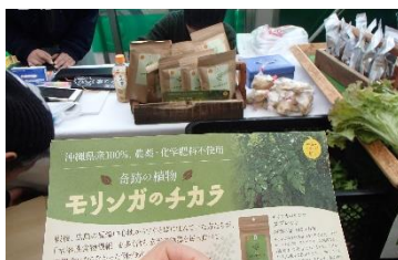
「モリンガのチカラ」注目のスーパーフードとのこと お茶ですよ。