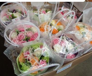
何と石けんでできたブーケ、いい香りがしてプレゼントにぴったり。