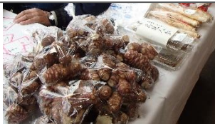
糖尿病によく効くといわれている「菊芋」が人気です。高麗人参のはちみつ漬けは体力回復に喜ばれています。