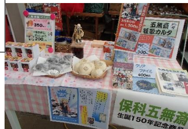
五萬齋研究会もカルタ・スイーツ・本を販売。スイーツも完売。カルタ2コ売れました。