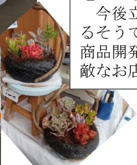
多肉植物の寄せ植え