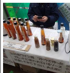
立科でワイン用ブドウを栽培。お酢やジャム状の様々な食品に加工している。

今後立科町でチョウザメの養殖も始めるそうです。アイデアと工夫で魅力的な商品開発をしています。町内のお店も素敵なお店がたくさんありました。