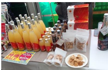
リンゴのドライフーズがサクサクしておいしかったです。