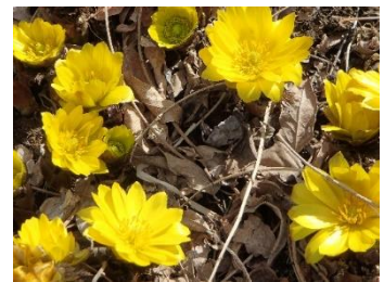
黄金の杯 陽だまりに

しかし条例では、「税金の滞納家庭は対象とならない事」や病気などで「18歳を過ぎて在学する場合などの救済措置がないこと」などを指摘し改善を求めつつも、制度自体は高校生を持つ家庭にとっては大きな負担軽減になることを考え、賛成しました。実現すれば長野県で初の試みとなり「子育て支援の町」として大きなアピールになったと思います。