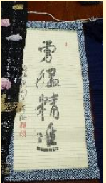
織物 「タペストリー」