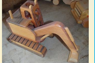
木のおもちゃ 「パワーシャベル」