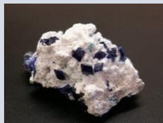
ヘンミライト (岡山県布賀山産)