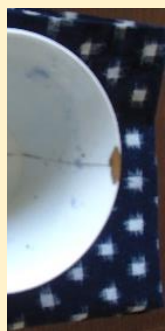
金継ぎ...大切な器がよみがえる