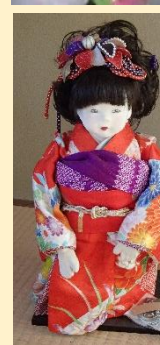
小諸スミレ人形 「綾ちゃん」