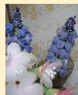
メッシュフラワー 「ムスカリ」