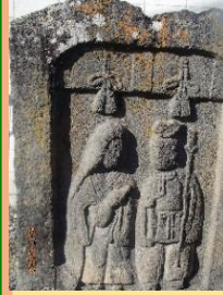
雅な道祖神 (公民館西)