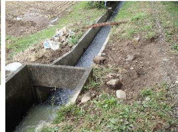
用水路のわきが大きくえぐられている。(西塩沢)