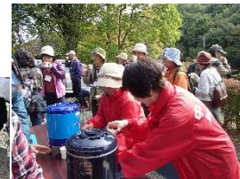
そば茶のサービス。「おいしい」と歓声が!

養成講座も何回も開催して、今回初めて蓼科高校生たちが芦田宿のガイドを務めました。高校生の活躍で華やかしました。