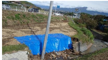
中山道ウォークの道すがら、ブルーシートが掛けられた護岸が見受けられた。(町区)