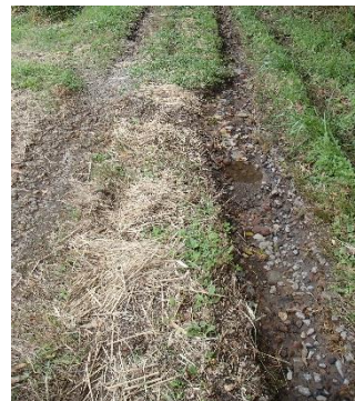
雨水でえぐられた農道。土砂が田んぼに流れ込んでいた。(西塩沢)