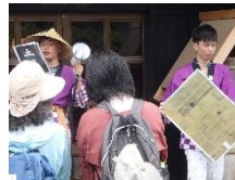
かわいい小坊主さんたち