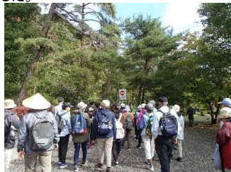
松並木街道を歩く参加者