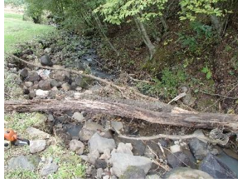
藤沢から桐原に向ける道路の左側、山の斜面が崩落し、倒木や土砂で埋まり、せき止められた水が田んぼに流入。すでに業者により、処理された。