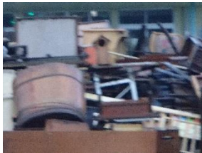
災害ごみの置かれた旧千草保育園、日常生活が破壊されてしまった。