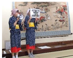
本陣(上)土屋旅館(下)の説明をする蓼科高校の生徒