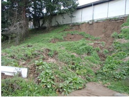
畜舎の南側が崩落・町道が埋まり、ガードレールもひん曲がった(蟹窪)