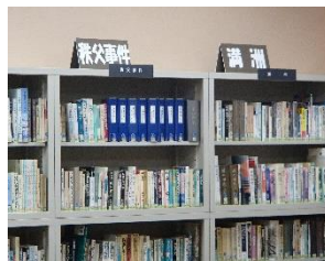
満蒙開拓・秩父事件に関する書籍類

夫に誘われ、初めて塩尻市の博物館「地球の宝石箱」を訪ねる。入ってすぐ右のフロアにあるのがコレ！ティラノザウルスの頭の化石は巨大で、その牙でガブリやられれば哺乳類の先祖などはひとたまりもなかったことでしょう。こうした恐竜時代や氷河期を生き延び、よくもここまで進化したものだと感慨に耽る。