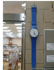
おしゃれな時計の壁掛