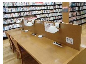
パソコンの利用もできるが電源は内臓バッテリー