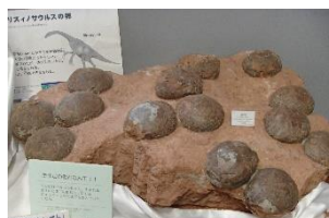
首長竜の卵の化石

夫に誘われ、初めて塩尻市の博物館「地球の宝石箱」を訪ねる。入ってすぐ右のフロアにあるのがコレ！ティラノザウルスの頭の化石は巨大で、その牙でガブリやられれば哺乳類の先祖などはひとたまりもなかったことでしょう。こうした恐竜時代や氷河期を生き延び、よくもここまで進化したものだと感慨に耽る。