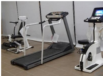
何かのついでに健康づくり

佐久穂町のイキイキ健康体操のDVDをいただきに、茂来館で待ち合わせ。指導者の先生から健康体操の解説とDVDをいただきました。保健委員会の活動に活かします。