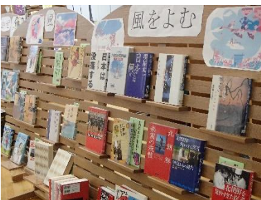
思わず手に取って読んでみたいという気にさせる本の紹介