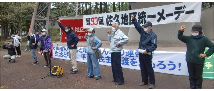
第33回佐久地区統一メーデー意気高く開催！

憲法記念日 立科町「ひまわり」共同鑑賞 17人参加。戦争の理不尽さに哀しきと非戦の誓いを新たにしました。会場でのカンパ2万円お寄せいただき、佐久ピースアクション経由でユニセフなどに送ってもらいます。