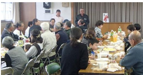
西塩沢公民館でみんなで食事会