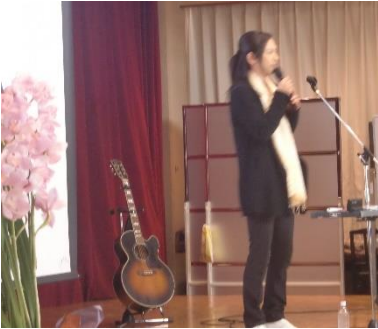
映像を映しながらの歌と語り。