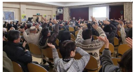
会場が一つになっ

「今は夢を持ち、好きなことができる時代。でもそれが許されなかった時代が、すぐ前のおじいさんの時代でした」と今ある自由を大事にしようと訴え、また絶対に戦争は繰り返してはならない」というのがこの世代からのメッセージと力を込めました。