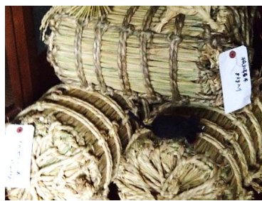
俵の鼠が米喰ってチュウ

以前、知り合いの家から預かったカエルのおもちゃ。ワラで作ってあり、早速名人の家に届け、「これつくれますかね?」とお話しておいたもの。「デキタヨ!」との連絡で駆けつけるとこのカエル君が泳いでいました。