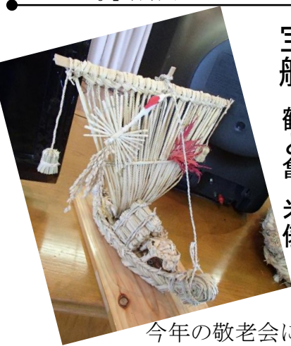
宝船・鶴と亀・米俵

今年の敬老会にお目見えした宝船。鶴の尾はお米のついた稲穂。船には米俵とわら細工の亀が載っています。おめでたい縁起物。正月用に作って下さいとお願いしました。