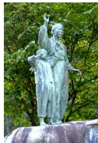
不戦の像 南相木村