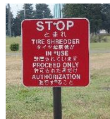
タイヤ裁断機が設置されていることを示す看板。許可なきものの立ち入り禁止の標識。

首都圏に外国軍の基地を置いているのは日本だけ。横田基地の撤去は当然の要求ではないでしょうか。